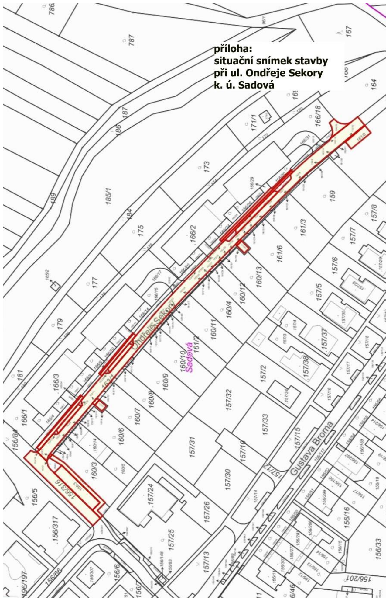
příloha: situační snímek stavby při ul. Ondřeje Sekory k. ú. Sadová