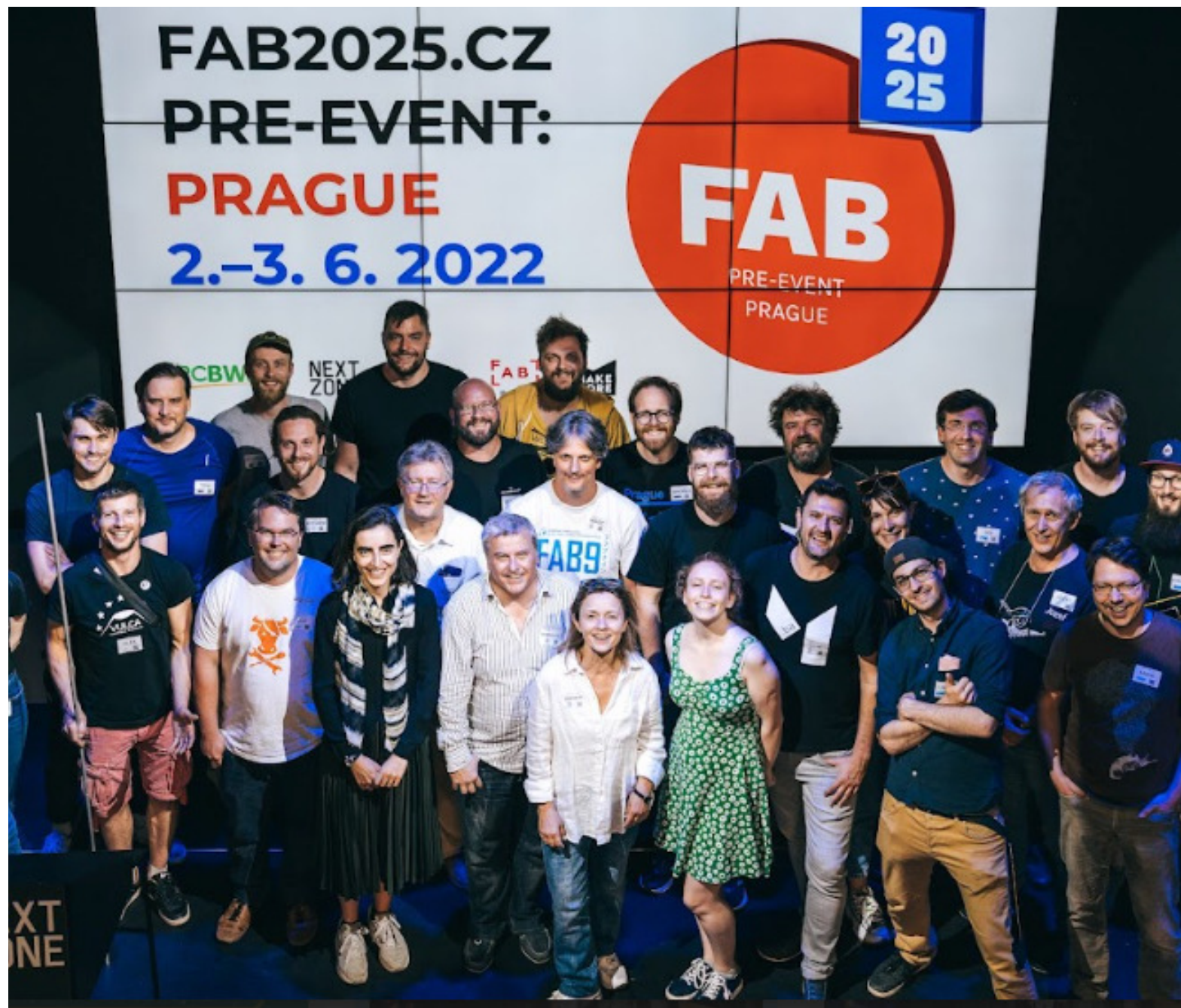
FOTO: Pre-event Praha