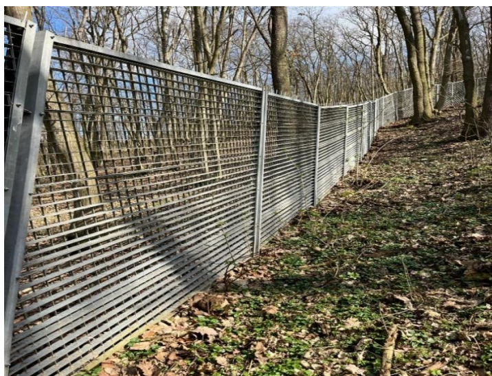
Obr.5: Nové systémové oplocení