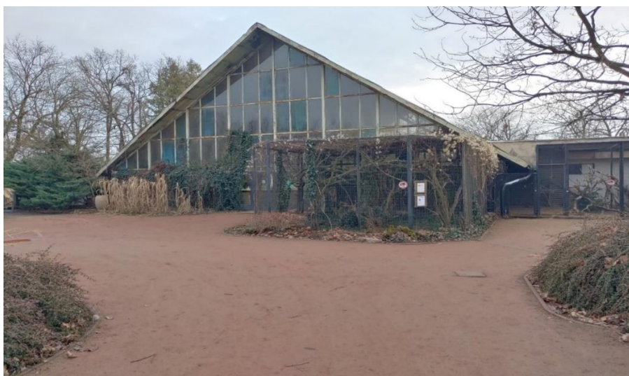
Obr. 3: Zoo Brno – vivárium s expozicí Tropického království – současný stav

Předpokládané náklady na průzkumy a předběžnou studii proveditelnosti jsou ve výši 700 tis. Kč a finanční částka bude pokryta ze zbylých finančních prostředků z akce ORG 2394 „Zoo Brno – lanová dráha“.