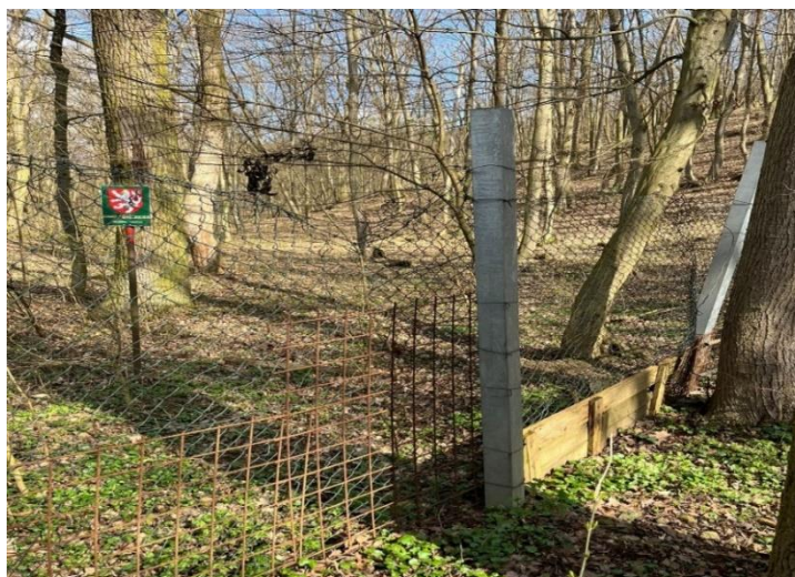
Obr.4: Stávající oplocení – úsek 4.1

Předpokládané náklady na dokončení poslední etapy oplocení jsou ve výši 6.000 tis. Kč