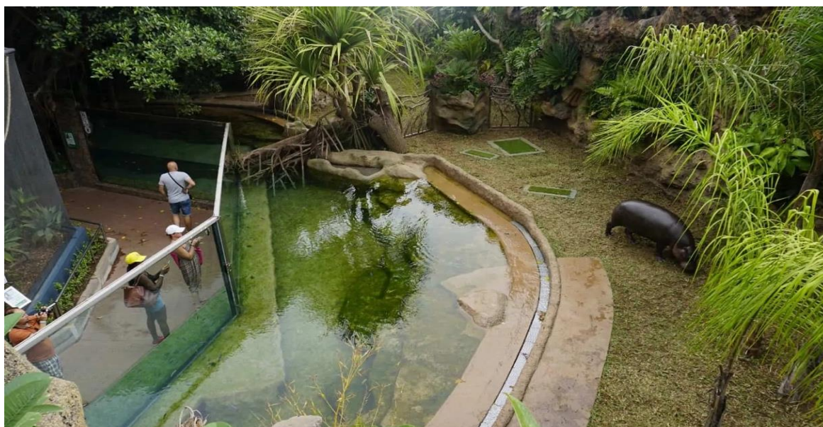
Obr. 1: Venkovní expozice hrošíků v zoo Loro Parque ve Španělsku

V současné době není k záměru zpracována žádná dokumentace. Předpokládané náklady na zpracování všech stupňů projektové dokumentace a provedení potřebných průzkumů jsou ve výši 1.839 tis. Kč. Tato finanční částka bude pokryta ze zbylých finančních prostředků z akce ORG 2394 „Zoo Brno – lanová dráha“ formou poskytnutého investičního příspěvku Zoo Brno.