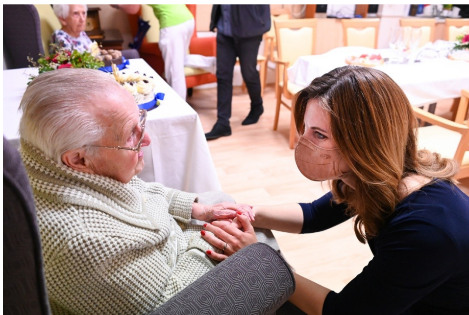
Gratulace ke 100. narozeninám – Domov pro seniory Kosmonautů (duben 2021)